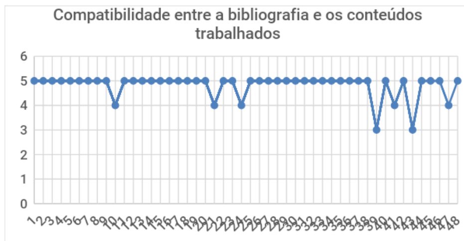
Figura 3 – Compatibilidade entre a bibliografia e os conteúdos trabalhados