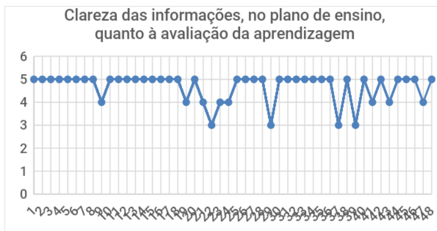
Figura 2 – Clareza das informações, no plano de ensino, quanto à avaliação da aprendizagem

Fonte: Elaborada pelos autores, com base na pesquisa realizada.