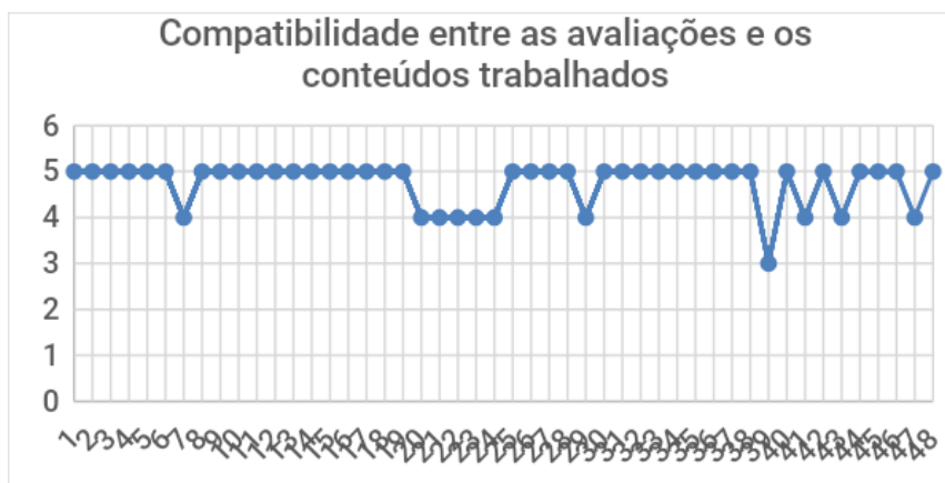
Figura 4 – Compatibilidade entre avaliações e os conteúdos trabalhados